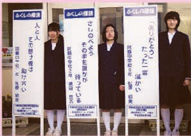
阿蘇中のみなさん