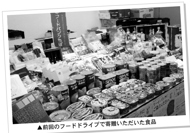
▲前回のフードドライブで寄贈いただいた食品

この度『フードバンクちば』では地域の諸団体のご協力のもとフードドライブ(余剰食品の回収)を開催します。ご家庭で余っている食品、不要な食品等があればぜひご寄贈ください。