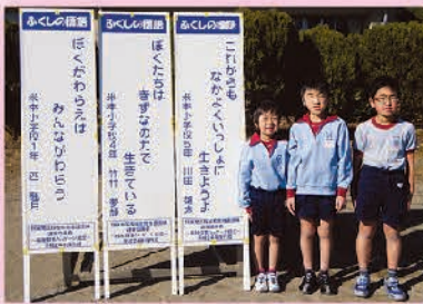
米本小のみなさん

温かな「ことば」 届きました！ ふれあいプラザに掲示し、 ご投票いただいた『ふくしの標語』 が決定しました！ 選ばれた作品は、阿蘇地域内で 立て看板として掲示されます。