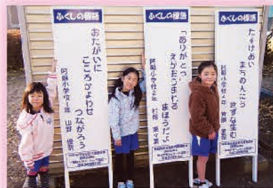
阿蘇小のみなさん