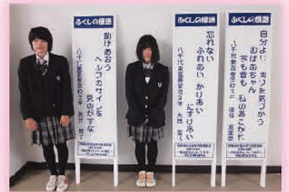
県立八千代東高等学校のみなさん

【参加校・参加者】阿蘇小学校・米本小学校・米本南小学校・阿蘇中学校・県立八千代東高等学校・阿蘇北部支会・米本支会