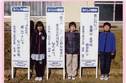
米本南小のみなさん

温かな「ことば」 届きました！ ふれあいプラザに掲示し、 ご投票いただいた『ふくしの標語』 が決定しました！ 選ばれた作品は、阿蘇地域内で 立て看板として掲示されます。