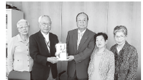
▲善行銀行にご寄付を頂いたロータスクラブ様

勝田台支会…12,000円 匿名…2,000円 千葉土建 八千代支部…4,000円 八千代市民プレーパーク…2,000円 ギターフェスティバル2015実行委員会 …6,460円 常和不動産(株)八千代ゴルフ事業所 …29,150円 ロータスクラブ…1,000,000円 やちよヶ台ケアセンターそよ風 …2,000円 緑が丘支会…10,000円 匿名…500円