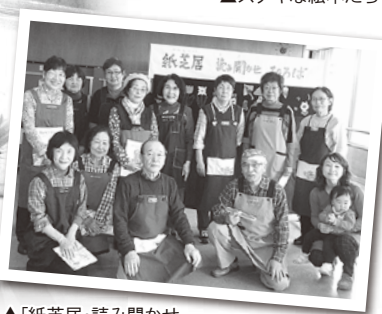
▲「紙芝居・読み聞かせ ひ☆ろ☆ば」のボランティアの皆さん