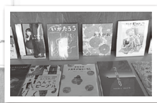
▲ステキな絵本たち