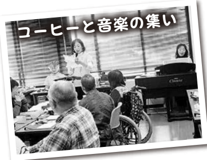
コーヒーと音楽の集い

楽しい催しがたくさん!赤ちゃんから年配の方まで誰もが一緒に楽しめる催しがいっぱい!毎月第3土曜日には福祉センターに笑顔とみんなの笑い声が響きます。たくさんのボランティアの方々と一緒に、楽しい一日を過ごしませんか?