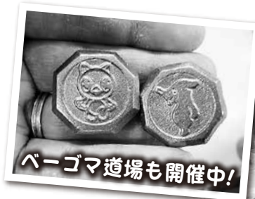
ベーゴマ道場も開催中!