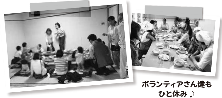
ボランティアさん達も ひと休み♪