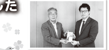
法人運営事業寄付金 D'sテーション八千代店様300,000円