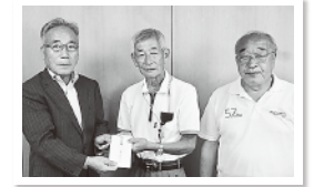
福岡県豪雨災害義援金 北東自治会様100,000円