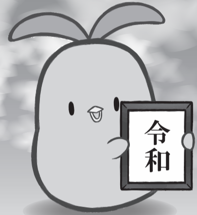
千葉県共同募金会マスコットキャラクター「びわびよ」

『ひとり、ひとりのやさしさが、私達の住む町をもっとやさしくしてくれる』今年も1本の赤い羽根に皆様の温かいご協力をお願い致します。