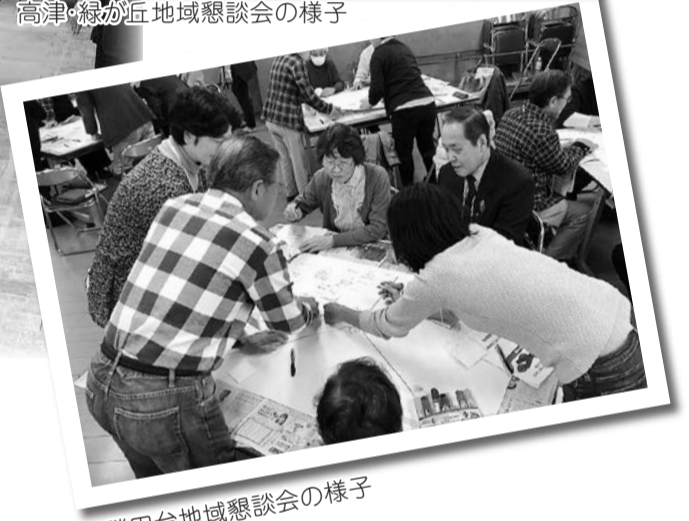
勝田台地域懇談会の様子