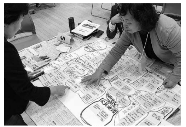
高津・緑が丘地域懇談会の様子