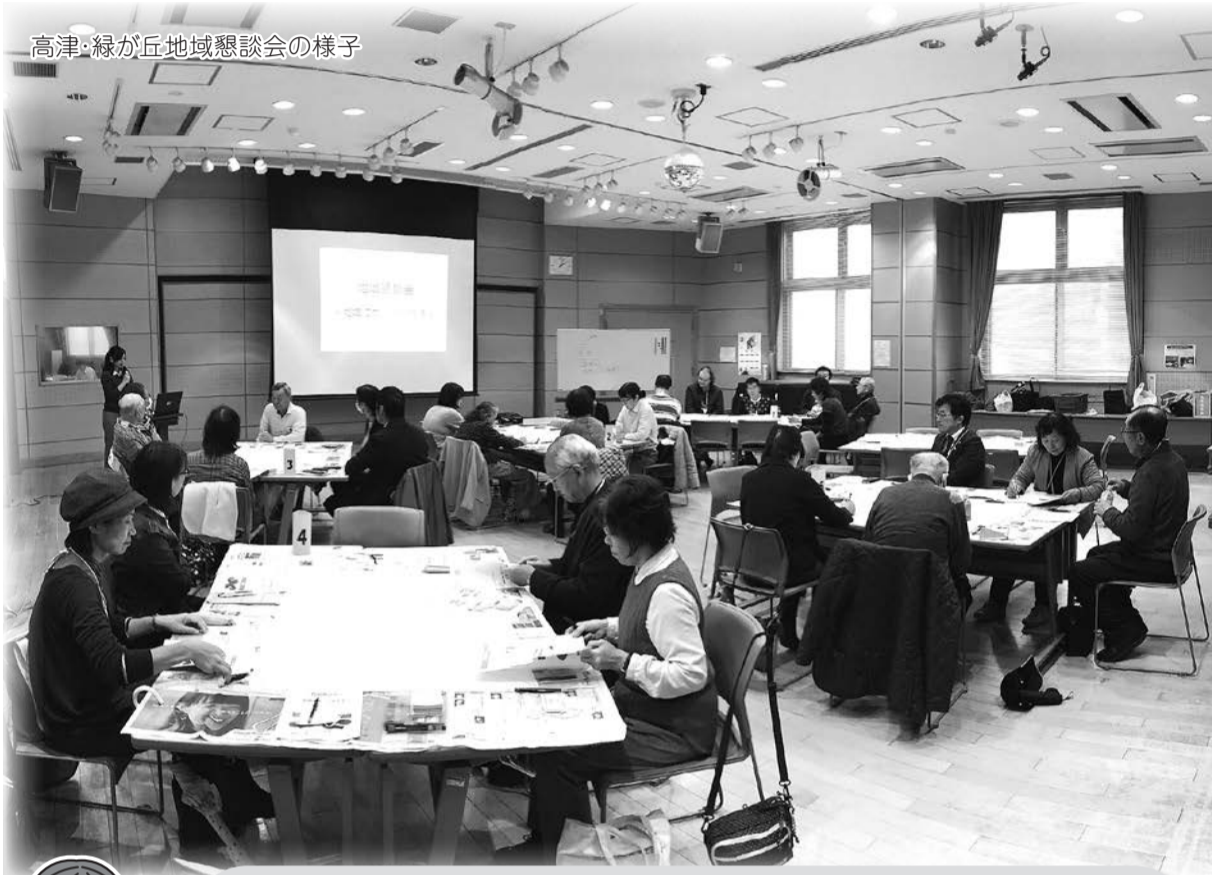
高津・緑が丘地域懇談会の様子

10月19日(土)～11月24日(日)に市内7地域で「地域懇談会」を開催しました。 各地域で様々な立場の方々から特色のあるご意見を伺うとともに、市内共通の課題 についても把握することができました。 7地域で伺ったご意見は、今後地域福祉計画および地域福祉活動計画に反映させて いただきます。