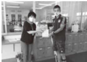
八千代台東中学校