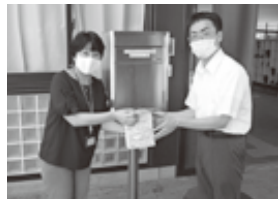
みどりが丘小学校