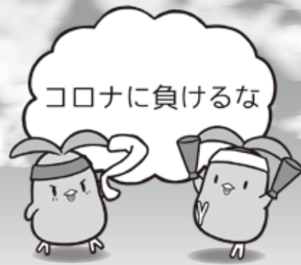
千葉県共同募金会マスコットキャラクター「びわびよ」

※毎年実施しております「街頭募金」は新型コロナウイルスの感染拡大防止を考慮し、中止することを決定いたしました。