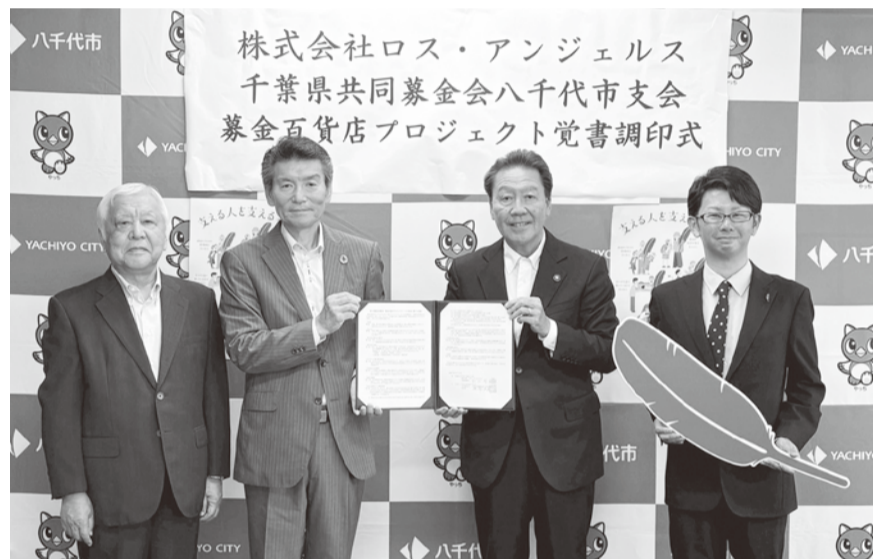
▲9月12日 覚書調印式 千葉県内第1号店は八千代市の「ロス・アンジェルス」に決定 きのこスープ1品につき30円が赤い羽根共同募金に寄付されます。