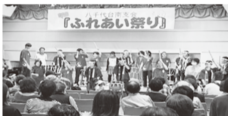
【八千代台南地区支会世代間交流】

地域のための民間財源である共同募金は、地域の孤立を防ぐため、子育て世代や高齢者・障がいを持つ方など様々な人たちがつながり合い・支え合う地域づくりのための支援を数多く行っています。